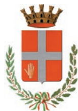
Comune di Borgomanero