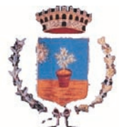
Comune di Bussoleno